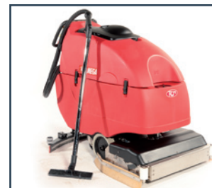
WASHING-DRYING DEVICE NASS- UND TROCKEN-EINRICHTUNG SEPARATE REINIGUNGSSLANG