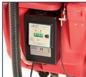
ON BOARD BATTERY CHARGER ON-BOARD-LADEGERÄT ON-BOARD BATTERIJLADER