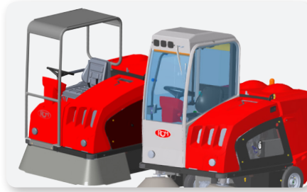
Tettuccio e cabina Canopy and cabin Techo y cabina