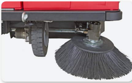
Braccio spazzola laterale sinistro Left side brush arm Brazo de cepillo lateral izquierdo