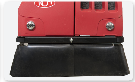
Convogliatore polvere Dust conveyor Encaminador de polvo