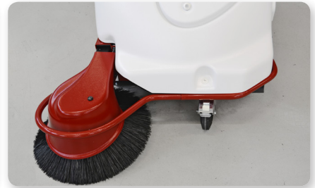
Paraurti Bumper Parachoques