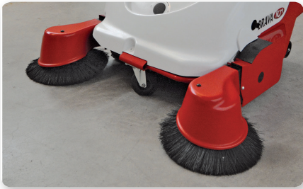
Braccio spazzola laterale sinistro Left side brush arm Brazo lateral izquierda