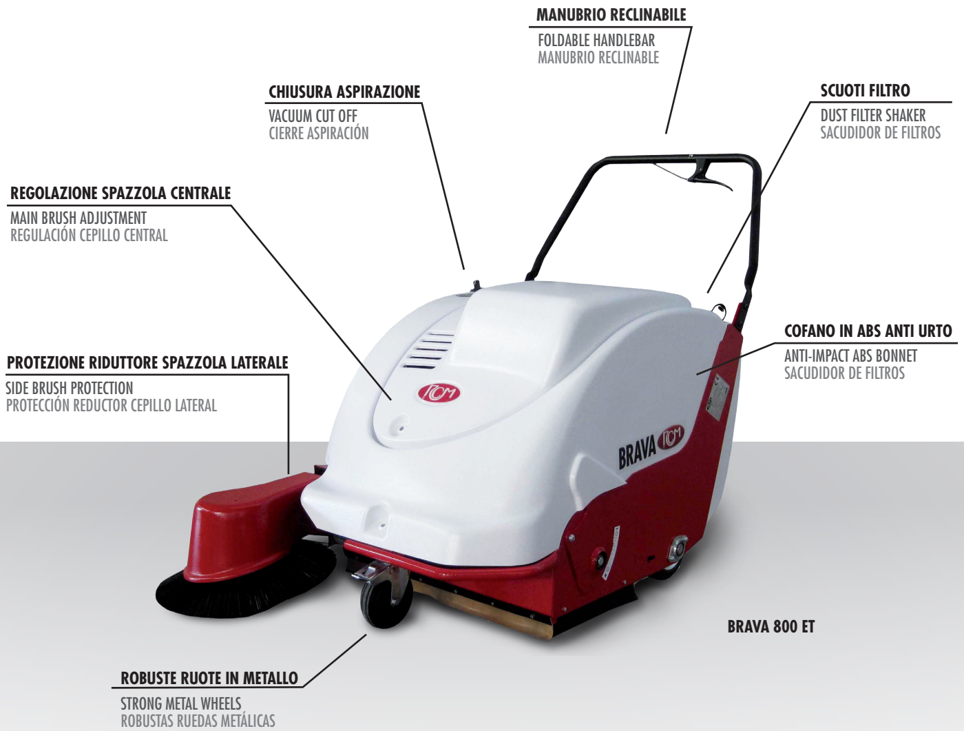
BRAVA 800 ET