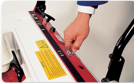
Scuotitore elettrico Electric filter shaker Sacudidor de filtro eléctrico