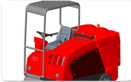
Tettuccio Canopy Techo