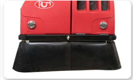
Convogliatore polvere Dust conveyer Encaminador de polvo