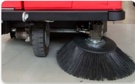
Braccio spazzola laterale Side brush arm Lateral izquierda